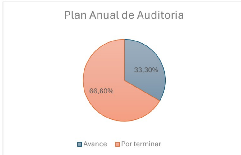
Grafica 1. Plan Anual de Auditoria por parte de la oficina de Control Interno

Por parte de la Oficina de Control Interno se presenta el avance frente al Plan Anual de Auditorias